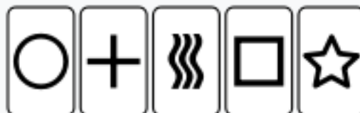
Les cartes de Zener

Carl Gustav Jung envisage l'existence d'un « savoir absolu » constitué par un inconscient collectif formé d'archétypes, et lié notamment à la doctrine platonicienne de la Réminiscence (ou anamnèse ). Pour prouver cette notion, Jung prend ainsi l'exemple de comportements innés ou de calculs impossibles comme ceux des rêves prophétiques. Le savoir absolu semble ainsi, selon lui, une propriété qu'a l'inconscient, de prévoir statistiquement l'occurrence de phénomènes réels. Certaines abstractions de la métaphysique ou de la science s'expliquent ainsi par ce savoir absolu ; Pauli a d'ailleurs montré dans son ouvrage que les représentations scientifiques (ou modèles), comme ceux de Kepler, de Kekulé ou d'Einstein, naissent d'images intérieures spontanées. Les expériences parapsychologiques comme la télépathie, ainsi que le montrent les investigations de Zener au moyen de cartes comportant des symboles à deviner, témoignent, pour Jung, de l'existence d'une capacité de calcul illimité de l'inconscient, en situation d'excitation (ce qui explique selon lui l'impossibilité de reproduire les cas).